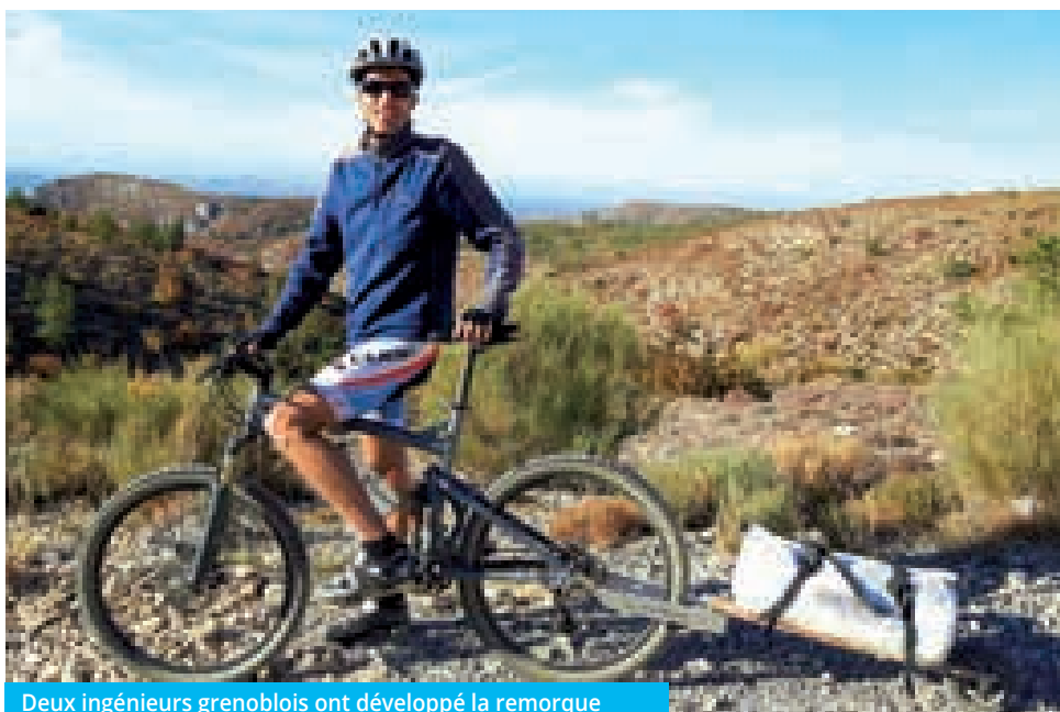
Deux ingénieurs grenoblois ont développé la remorque pliable qui leur manquait et créé Zap Outdoor.

Debon, « la marque des connaisseurs », fut avalée en 1962 par Peugeot. Vario, inventeur des premiers VTT de descente à géométrie variable en 1993, connut un succès fulgurant avant d'être absorbé puis délocalisé. Plus récemment, les cyclos haut de gamme en fibre de carbone tressée de Time International, ancien fleuron nord-isérois, ont connu aussi des difficultés. Reprise par Rossignol en 2016 pour l'euro symbolique, l'entreprise vient d'être revendue à un groupe d'investissement